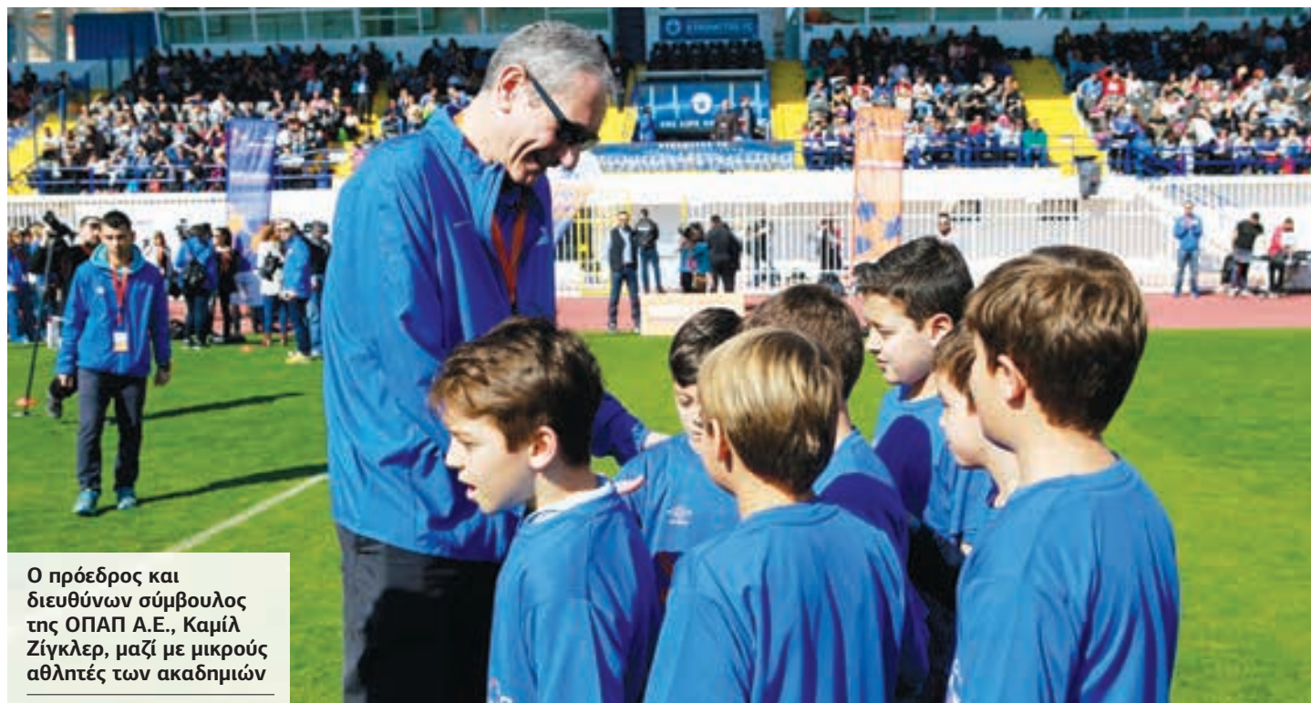
Ο πρόεδρος και διευθύνων σύμβουλος της ΟΠΑΠ Α.Ε., Καμίλ Ζίγκλερ, μαζί με μικρούς αθλητές των ακαδημιών