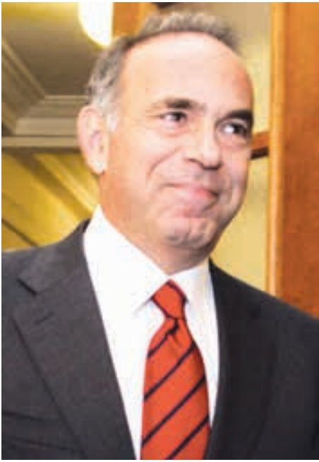
Του Κωνσταντίνου Αρβανιτόπουλου(*)

Τ ο 2012, όταν αναλάβαμε την διακυβέρνηση της χώρας, το εκπαιδευτικό σύστημα ήταν στην Εντατική. Ο νόμος 4009 παρέμενε ανεφάρμοστος, ο ακαδημαϊκός χάρτης της χώρας άναρχος, οι καθηγητές χωρίς αξιολόγηση, φωτοτυπίες αντί για βιβλία, κι ένα λύκειο φροντιστήριο.