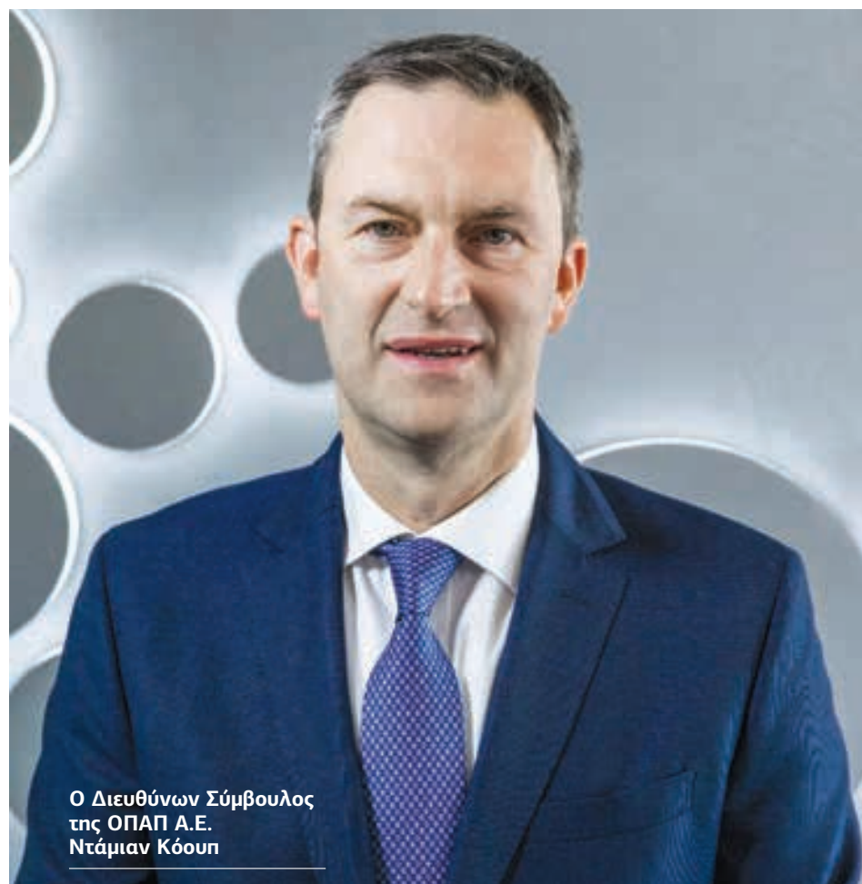
Ο Διευθύνων Σύμβουλος της ΟΠΑΠ Α.Ε. Ντάμαν Κόουπ

στη διαδραστική παρέμβαση στα παιδιά, τους γονείς και τους προπονητές των συμμετεχόντων σωματείων, με σκοπό τη φροντίδα της σωματικής και ψυχικής υγείας των παιδιών και περιλαμβάνει: