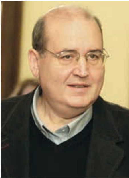
Του Νίκου Φίλη (*)

Μ ε σειρά νομοθετικών ρυθμίσεων και διοικητικών αποφάσεων αντιστρέψαμε, παρά τις αντίξοες οικονομικά συνθήκες, την συνεχή μείωση των κονδυλίων του προϋπολογισμού για την Παιδεία και την Έρευνα, επαναφέραμε την ακαδημαϊκή λειτουργία στα ΑΕΙ, δημιουργήσαμε όρους σύνδεσης ΑΕΙ και ερευνητικών κέντρων, προκλήσαμε νέες θέσεις πανεπιστημιακών, οργανώσαμε μέσω του ΕΛΙΔΕΚ προγράμματα υποτροφιών σε υποψηφίους διδάκτορες και μεταδιδάκτορες με στόχο τον περιορισμό και την ανακοπή της φυγής των επιστημόνων μας στο εξωτερικό. Δίνουμε την δυνατότητα σε όλους τους φοιτητές, ανεξάρτητα από το εισόδημά τους, να παρακολουθήσουν Μεταπτυχιακά Προγράμματα, εάν το επιθυμούν και πληρούν τα κριτήρια επιλογής.