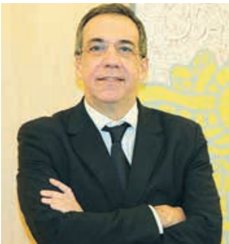
Ο διευθύνων σύμβουλος της Εθνικής Τράπεζας, Λεωνίδας Φραγκιαδάκης

Ο κ. Φραγκιαδάκης δήλωσε ότι «η Εθνική Τράπεζα παραδοσιακά στηρίζει την εκπαίδευση και είναι μεγάλη μας χαρά που υποστηρίζουμε το συγκεκριμένο έργο Edulabs, καθώς και την χορηγία των 1.000 ηλεκτρονικών υπολογιστών στα σχολεία της Περιφέρειας. Είμαστε αρωγοί στο να δημιουργήσει αυτή η χώρα πολίτες, οι οποίοι θα είναι οικονομικά ενεργοί και καλά εκπαιδευμένοι για να συμμετέχουν στην νέα ψηφιακή κοινωνία».