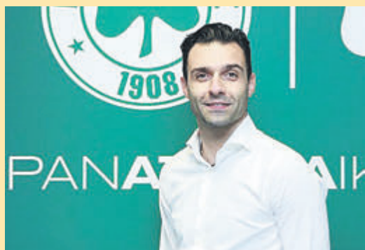
Ο Αλαφούζος πήρε τον Τζαβέλα για τους διαιτητές ▶ ΣΕΛ. 30