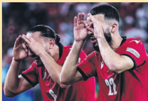
Κατόρθωμα Μπαλτάκου: Όλα τα Βαλκάνια στο EURO εκτός από την Ελλάδα... ▶ ΣΕΛ. 28