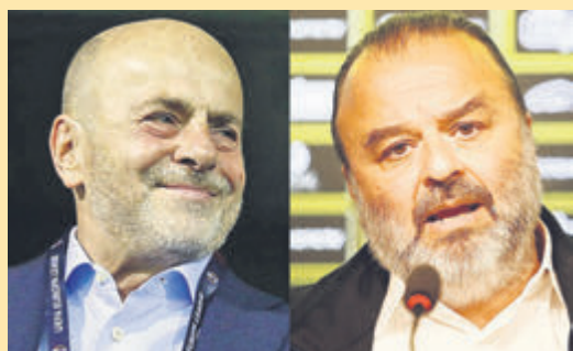
Με Αλαφούζο η πρώτη ήττα του Ηλιόπουλου... ▶ ΣΕΛ. 28