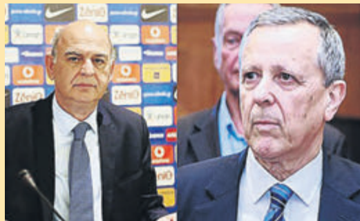
Μετά ήρθαν οι Γραμμένοι και οι Μπαλτάκοι... ▶ ΣΕΛ. 27