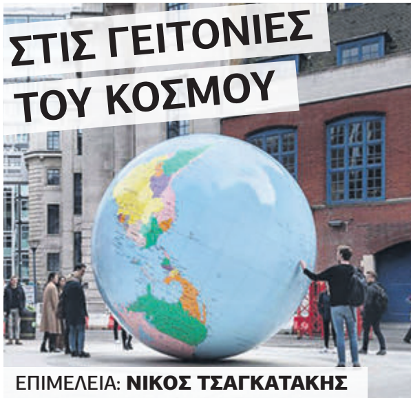
ΕΠΙΜΕΛΕΙΑ: ΝΙΚΟΣ ΤΣΑΓΚΑΤΑΚΗΣ