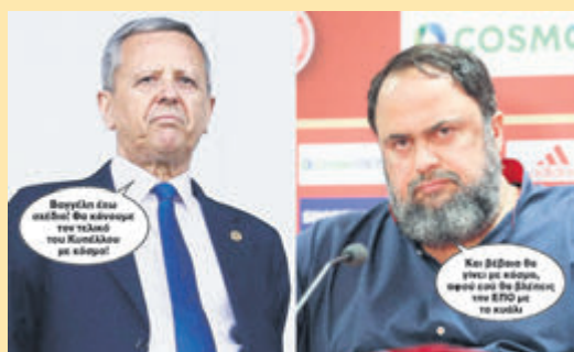
≥ Μπαλτάκος: Βαγγέλι έχω σχέδιο! Θα κάνουμε τον τελικό του Κυπέλλου με κόσμο! ≥ Μαρινάκης: Και βέβαια θα γίνει με κόσμο, αφού εσύ θα βλέπεις την ΕΠΟ με το κυάλι ▶ ΣΕΛ. 26