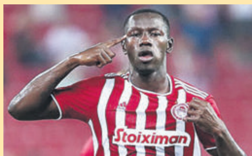
Πέσανε κάτω στον ΠΑΟΚ με τα λεφτά που ζητάει ο Καμαρά ▶ ΣΕΛ. 20