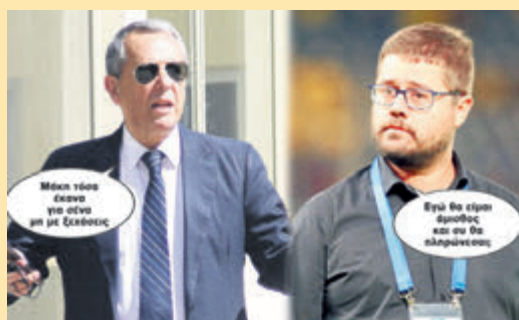
≥ Μάκη τόσα έκανα για σένα μη με ξεχάσεις ≥ Εγώ θα είμαι άμισθος και συ θα πληρώνεσαι; ▶ ΣΕΛ. 16