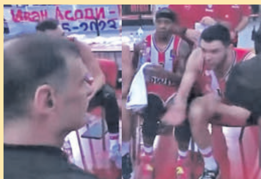
Ο τσαμπουκάς του Παπανικολάου στον Μπαρτζώκα είναι η αρχή του τέλους ▶ ΣΕΛ. 18