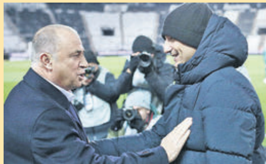
Η μεγάλη διαφορά του Λουτσέσκου με τον Τερίμ ▶ ΣΕΛ. 20