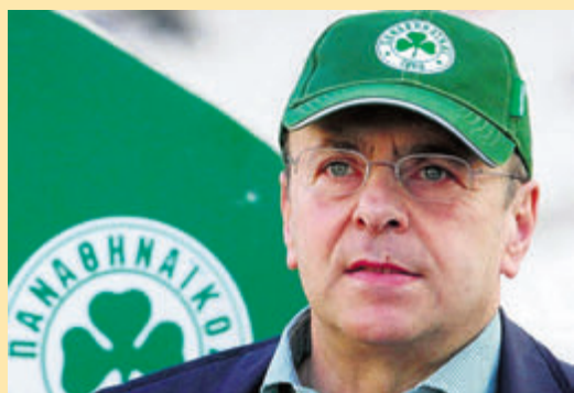
Το δράμα του Αλαφούζου: Ποιος θα αγοράσει την ΠΑΕ; ▶ ΣΕΛ. 19