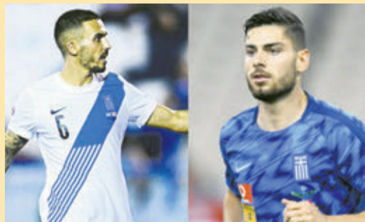
Μην την πατήσει όπως ο Κουρμπέλης ο Μασούρας ▶ ΣΕΛ. 21