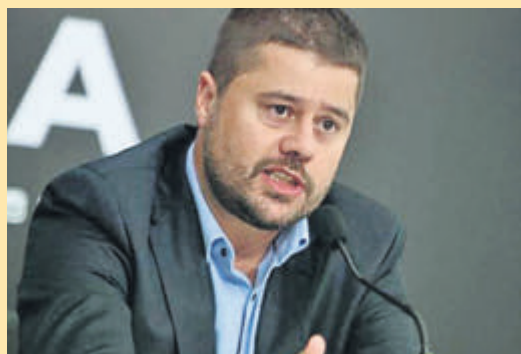
Στον ΠΑΟΚ άρχισε η καταμέτρηση ψήφων για τις εκλογές ▶ ΣΕΛ. 18