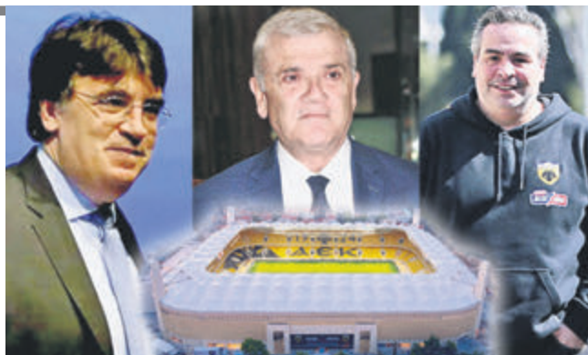
Οι Τιγηρτέχνες τρέλναν τον Δημάτο στα τηλέφωνα, μήπως και η UEFA έχει plan B για το Conference και η ομάδα του Πειραιά δεν παίξει με την Φιορεντίνα στον τελικό στην «ΟΠΑΠ Arena – Αγία Σοφία», μήπως και οι οπαδοί του καταστρέψουν το γήπεδο ▶ ΣΕΛ. 12-13