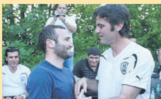
Σε πλειστηριασμό η μεζονέτα του Βρύζα μετά από αγωγή του Σαλπγιγίδη ▶ ΣΕΛ. 16