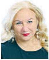
Άρθρο της Άννας Στεργίου (*)

Η ψηφιακή τεχνολογία μπορεί να μπάκε στη ζωή των Ελλήνων αρκετά αργά σε σχέση με άλλες χώρες αλλά την περίοδο της πανδημίας βελτίωσε αισθητά τα μεγέθη της.