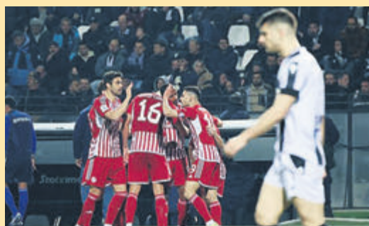
Το μισό πρωτάθλημα παίζεται στην Τούμπα ▶ ΣΕΛ. 15