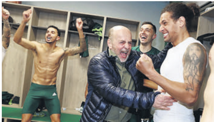
Με την πλάτη στον τοίχο ο Γιάννης Αλαφούζος δέχεται όσο κανείς την πίεση για την αστοχία των επιλογών του. Ο Φατίχ Τερίμ βγάζει την ουρά του απέξω για τις αποτυχίες του Παναθηναϊκού και ο κόσμος είναι έτοιμος να εκραγεί κατά του ιδιοκτήτη ▶ ΣΕΛ. 11