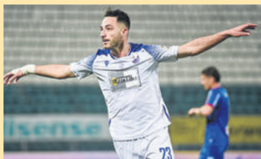
Ο Πανουργιάς ήξερε ότι ο Τσιλούλης μιλάει με τον Μελισσανίδη; Θα τον βάλει να παίξει με Ολυμπιακό, Παναθηναϊκό, ΠΑΟΚ; ▶ ΣΕΛ. 18