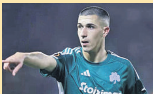
«Ψάχνεται» ο Αϊτόρ... ▶ ΣΕΛ. 21