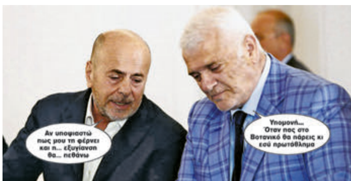
≥ Αν υποφιαστώ πως μου τη φέρνει και π... εξυγίανση θα... πεθάνω ≥ Υπομονή... Όταν πας στο Βοτανικό θα πάρεις κι εσύ πρωτάθλημα ▶ ΣΕΛ. 16