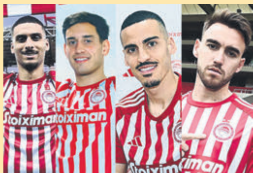
Η τετράδα που άλλαξε τον Ολυμπιακό ▶ ΣΕΛ. 21