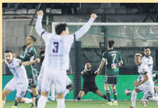
Όλοι με τον Παναθηναϊκό ξεχρέωσαν τις τιμωρίες τους! ▶ ΣΕΛ. 21