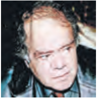
Γράφει ο Γιώργος Αρκουλίας

Ο σημαντικός Πειραιώτης συνθέτης Δήμος Μούτσης, αναφερόμενος, κάποτε, στους κορυφαίους του ελληνικού τραγουδιού, είχε επισημάνει σε δημοσιογράφο: «Φίλε μου, οι μεγαλύτερες φωνές είναι ο Μπιθικώτσης και η Μπέλλου».