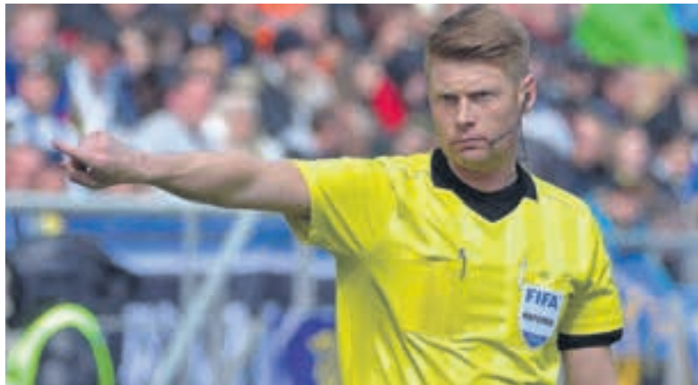
Ο ρέφερι Κρίστιαν Νίνγκερτ του αγώνα είναι «ψυχάκι» και δεν ανέχεται τα υβριστικά πανό στην κερκίδα, το ίδιο είχε κάνει και στο ματς Χόφενχαϊμ - Μπάγερν, που το διέκοψε ▶ ΣΕΛ. 12-13