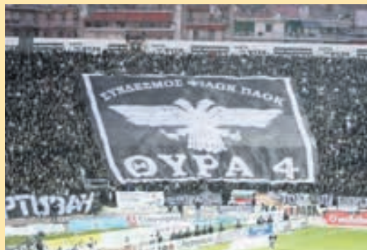
Με κρατικά λεφτά η νέα Τούμπα, για ν' απαγορεύει η Θύρα 4 να παίζει εκεί η εθνική ▶ ΣΕΛ. 19