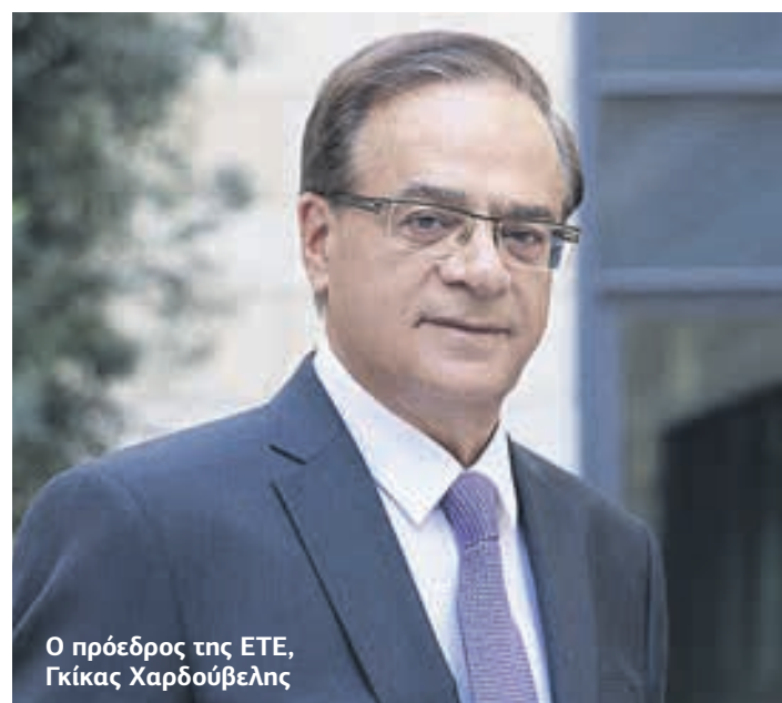
Ο πρόεδρος της ΕΤΕ, Γκίκα Χαρδούβελη

Δεν είναι όμως μόνο η μοναδικότητα της ιστορίας της Εθνικής Τράπεζας, αλλά και το δυναμικό μέλλον της που έπειτα από πολλά χρόνια σημαντικών προκλήσεων για την εγχώρια παγκόσμια οικονομία σηματοδοτείται όχι μόνο από το συνεχιζόμενο φιλόδοξο πρόγραμμα μετασχηματισμού της αλλά και από την πλήρη ανανέωση της εταιρικής της εικόνας. Αντλώντας έμπνευση από τη μακρόχρονη ιστορία της Εθνικής Τράπεζας αυτή η καινούργια εικόνα του brand name της ΕΤΕ έχει κάνει το ντεμπούτο της εδώ και μερικά 24ωρα και διατηρεί στο επίκεντρο της αποτύπωσής του το εμβληματικό κτίριο της οδού Αιόλου, απέναντι από το παλιό Δημαρχείο της Αθήνας, στην πλατεία Κοτζιά, αξιοποιώντας περαιτέρω το σχήμα της έλλειψης ως σύμβολο συνεχούς εκσυγχρονισμού, ανανέωσης, αέναης εξέλιξης. Η ανανεωμένη ταυτότητα υποστηρίζεται από μια σύγχρονη,