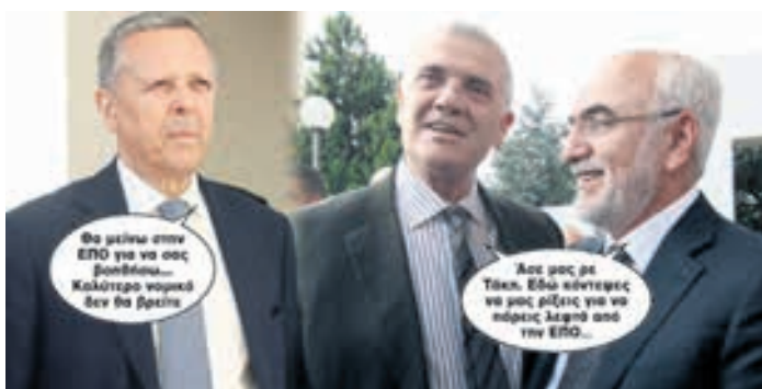
≥ Θα μείνω στην ΕΠΟ για να σας βοηθήσω... Καλύτερο νομικό δεν θα βρείτε. ≥ Άσε μας ρε Τάκη. Εδώ κόντεψες να μας ρίξεις για να πάρεις λεφτά από την ΕΠΟ... ▶ ΣΕΛ. 16