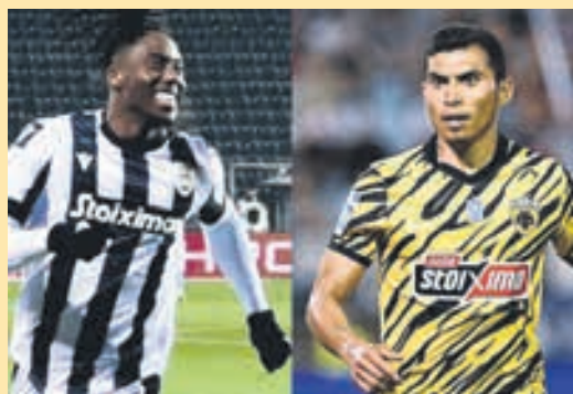
Ο Μείτε για τον ΠΑΟΚ, ό,τι ο Πινέδα για την ΑΕΚ ▶ ΣΕΛ. 21