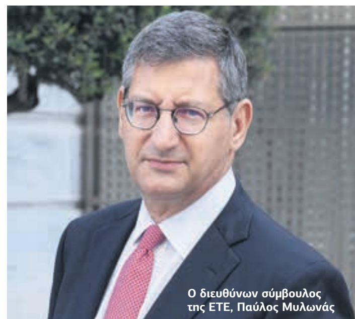
Ο διευθύνων σύμβουλος της ΕΤΕ, Παύλος Μυλωνάς

ανθρωποκεντρική καμπάνια, που ανοίγει το διάλογο με το κοινό και που μαζί με τη νέα, σύγχρονη ταυτότητα εκφράζουν την «Εθνική Τράπεζα του Σήμερα».