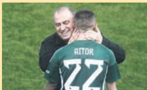
Ο Τερίμ τελειώνει τον Αϊτόρ του... Γιοβάνοβιτς ▶ ΣΕΛ. 17