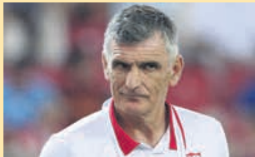
Αλλάζει... ταχύτητα ο Ολυμπιακός με Μεντιλίμπαρ ▶ ΣΕΛ. 11