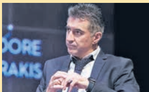
Ο Ζαγοράκης εκτός ευρω-ψηφοδελτίου και ΕΠΟ ▶ ΣΕΛ. 18