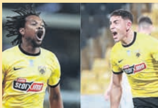
Η πρόκληση για Λιβιά και Πόνσε ▶ ΣΕΛ. 17