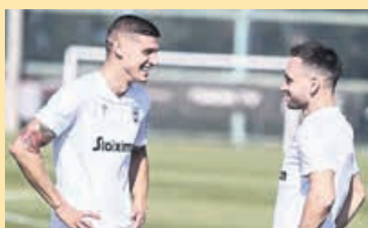
Δεν χωράνε μαζί Ζίφκοβιτς και Ντεσπόντοφ ▶ ΣΕΛ. 20