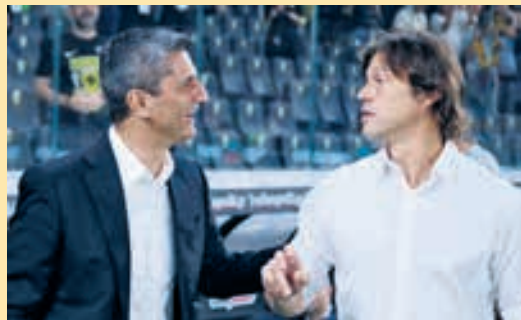
Αλμείδα: Ο κακός δαίμονας του Λουτσέσκου ▶ ΣΕΛ. 22