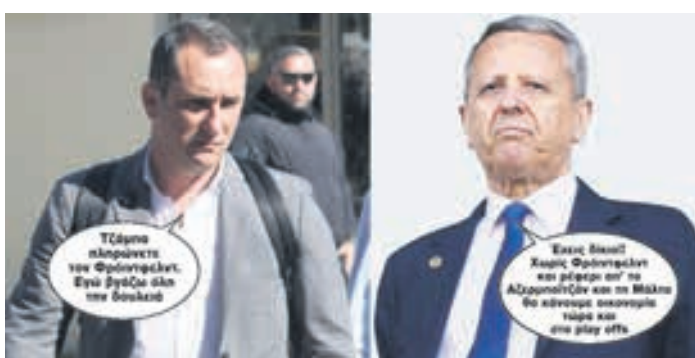
≥ Τζάμπα πληρώνετε τον Φρόντφελντ. Εγώ βγάζω όλη την δουλειά. ≥ Έχεις δίκιο!! Χωρίς Φρόντφελντ και ρέφερι απ' το Αζερμπαϊτζάν και τη Μάλτα θα κάνουμε οικονομία τώρα και στα play offs ▶ ΣΕΛ. 16