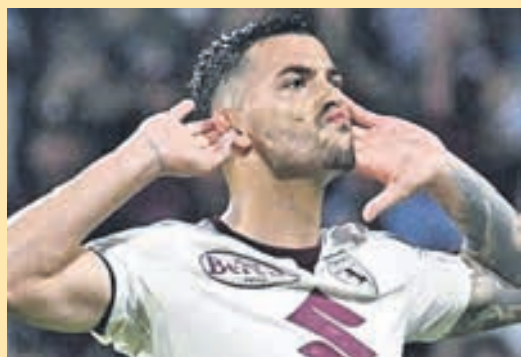
Πως χάθηκε ο Ράντονιτς για τον Ολυμπιακό ▶ ΣΕΛ. 21