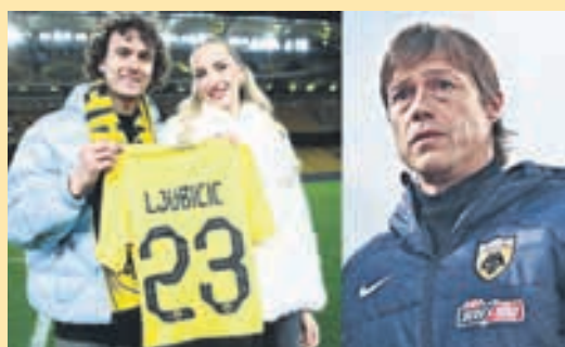
Λιούμπισιτς: Ο Αλμείδα έφερε δεύτερο Πινέδα ▶ ΣΕΛ. 11