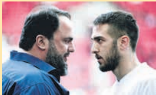
Τι θα κρίνει την ανανέωση του Φορτούνη στον Ολυμπιακό ▶ ΣΕΛ. 17