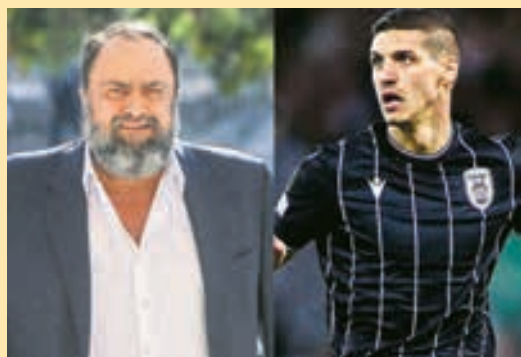
Είπε στον Μαρινάκη ότι ο Ντεσπόντοφ κοστίζει 12 εκατ. ευρώ ▶ ΣΕΛ. 18