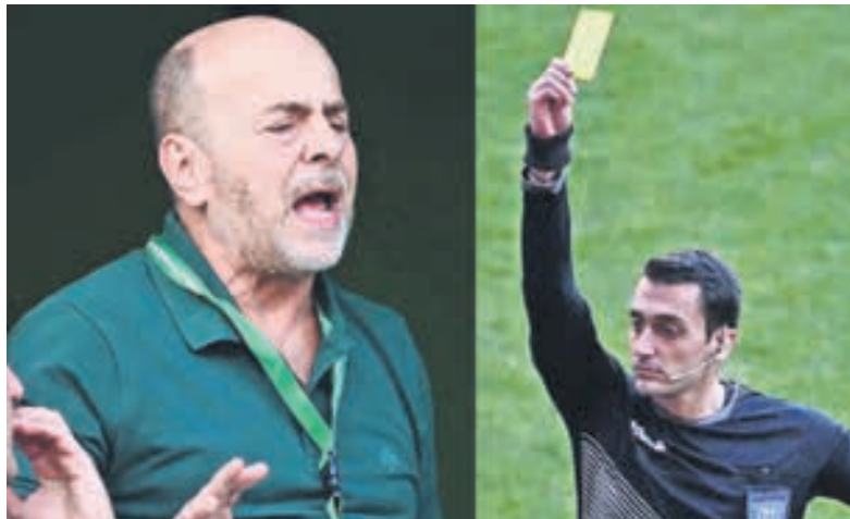
Γι αυτό τα έχωσε στον Λουτσέσκου με εξώδικα για να φτιάξει κλίμα και να στείλει μήνυμα στον Μάνταλο ότι μπορεί να πάρει την ομάδα και να την κάνει από την Τούμπα ▶ ΣΕΛ. 12-13