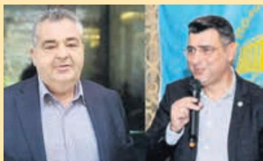
Έμπλεξε ο Διακοφώτης με τον Γιαννίδη και στο βάθος... Μπαλτάκος ▶ ΣΕΛ. 16