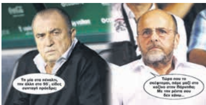
≥ Τη μία στα πέναλτι, την άλλη στο 95', είδες συνταγή πρόεδρε; ≥ Τώρα που το σκέφτομαι, πάμε μαζί στο καζίνο στην Πάρνηθα; Με την ρέντα σου δεν κάνω... ▶ ΣΕΛ. 16