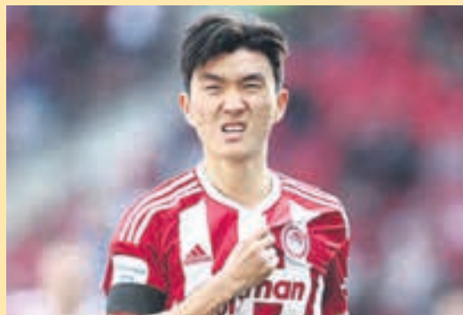
Ο Χουάνγκ ψάχνεται να φύγει ▶ ΣΕΛ. 21